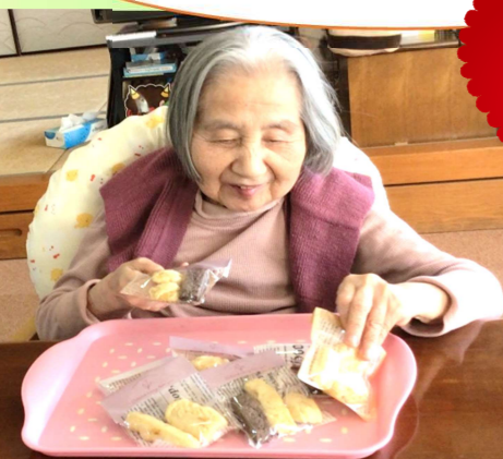
Happy Valentine's Day